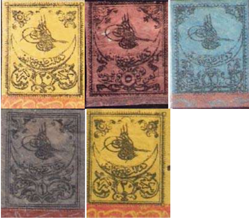
1862 – 1865 arasında çıkarılan ilk Osmanlı pullarının ikinci ve üçüncü emisyonlarından örnekler.

Teslim alınan gönderilere o merkezin damgası vuruluyordu. Başlangıçta yuvarlak negatif mühür biçiminde olan damgalarda “An canibi postahane-i” deyiminden sonra merkezin adı yazılıydı ve en altta yıl gösteriliyordu. Örneğin Resim 3’teki jurnalin üst kısmındaki mühürde “An canibi postahane-i Şumnu”, alt taraftaki mühürde ise “An canibi postahane-i Ruscuk” yazılıdır. Bu damgalar imparatorluğun sona erdiği 1918 yılına kadar birçok değişikliğe uğramıştır.