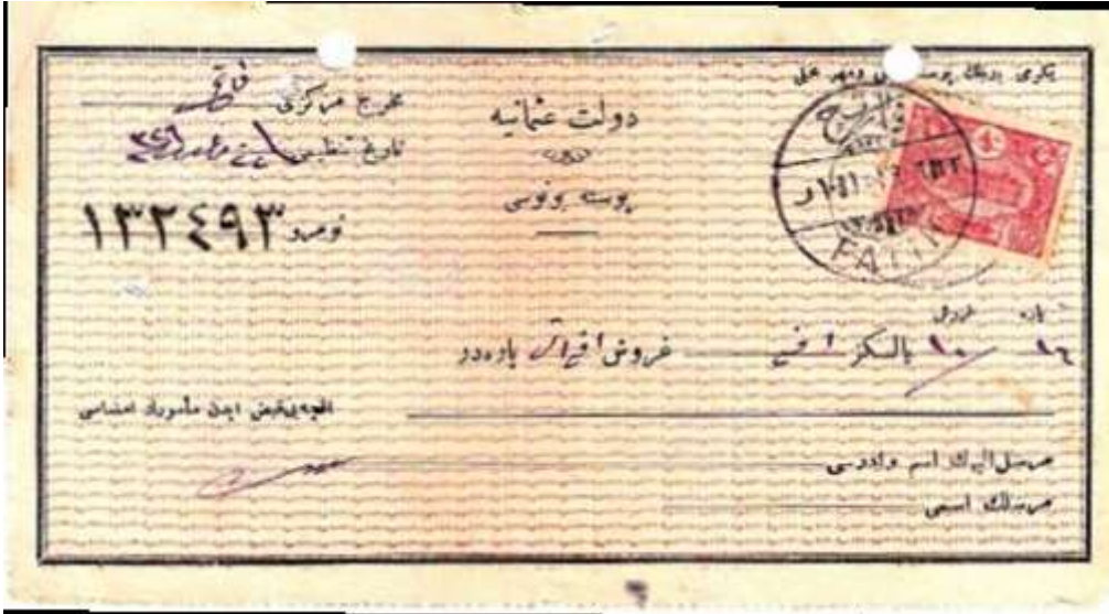
1913'te çıkarılan posta bonosu.

Teslim alınan gönderilere o merkezin damgası vuruluyordu. Başlangıçta yuvarlak negatif mühür biçiminde olan damgalarda “An canibi postahane-i” deyiminden sonra merkezin adı yazılıydı ve en altta yıl gösteriliyordu. Örneğin Resim 3’teki jurnalin üst kısmındaki mühürde “An canibi postahane-i Şumnu”, alt taraftaki mühürde ise “An canibi postahane-i Ruscuk” yazılıdır. Bu damgalar imparatorluğun sona erdiği 1918 yılına kadar birçok değişikliğe uğramıştır.