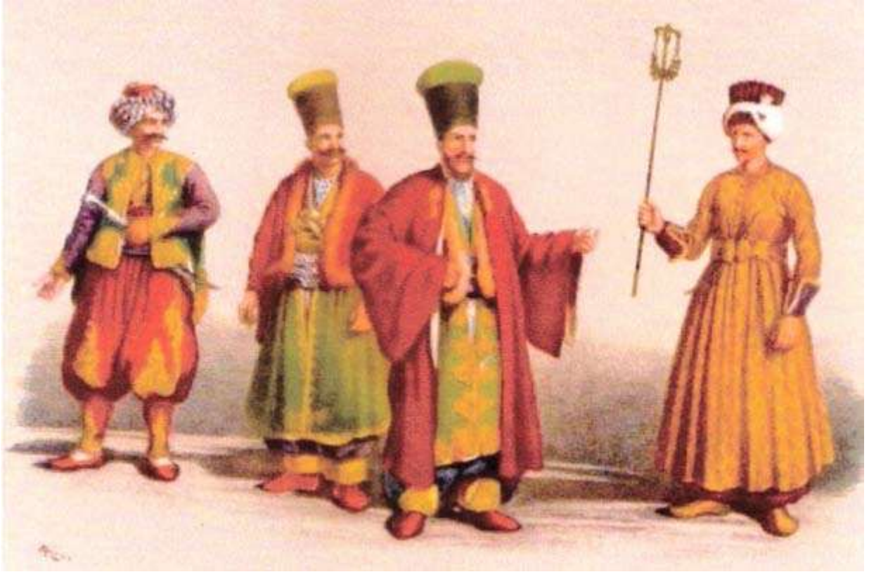
Tanzimat dönemi Posta Tatarı.

Osmanlı postasının tarihi, Tanzimat öncesi ve sonrası olmak üzere iki döneme ayrılarak incelenmelidir. Tanzimat'ın ilanından hemen sonra 1840'ta Posta Nezareti'nin kurulması, imparatorluğun geniş coğrafyasında yaşayan sivil halka düzenli posta hizmetinin verilmeye başlamasına olanak sağladı. Bundan önce ise yazılı haberleşme aşağıda ayrıntıları incelenecek olan menzil sistemi çerçevesinde yürütülüyordu ve yalnızca resmi evrakın iletilmesine elveriyordu.