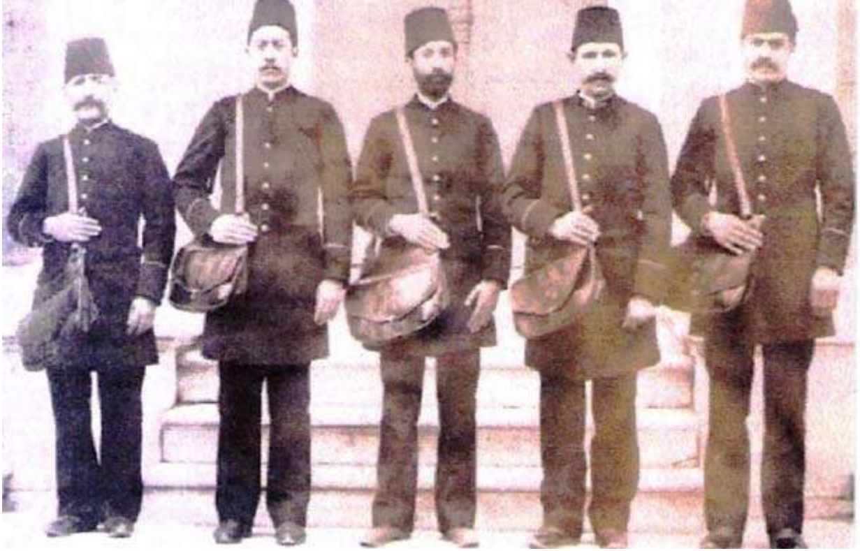
Sultan Abdülhamid dönemi posta dağıtıcıları.