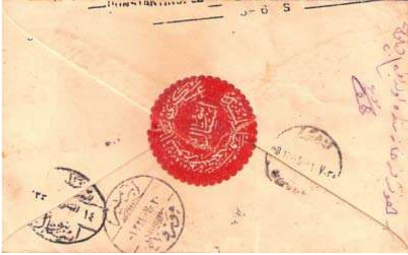
İstanbul'a ait sansür etiketiyle kapatılmış bir zarf.