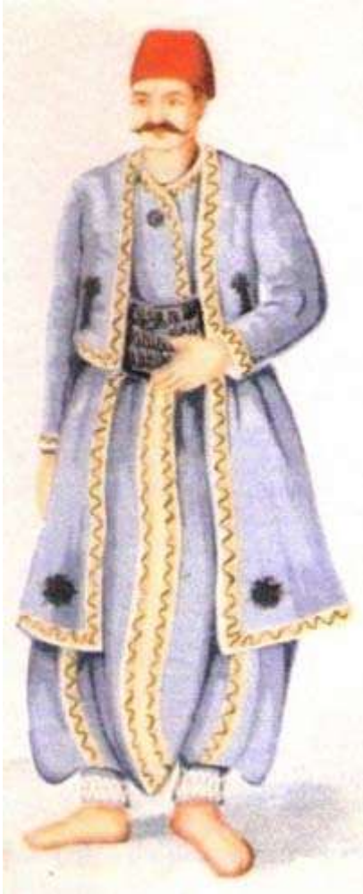
Tanzimat dönemi Posta Tatarı.

posta tarihi açısından belki de en önemli sonucu tüm menzilhânelerde "İn'âmât" adı verilen defterlerin tutulmaya başlanmış olmasıdır. Bu defterlere menzilhânelerden beygir sağlanan ulakların unvanları, görevleri, gittikleri yerler ve aldıkları beygir sayısı işlenmekteydi. Devletin yürüttüğü resmi haberleşmenin istatistiksel anlamda analizinin yapılabilmesine elveren bu veriler, günümüz tarihçileri için önemli kaynaklardır.