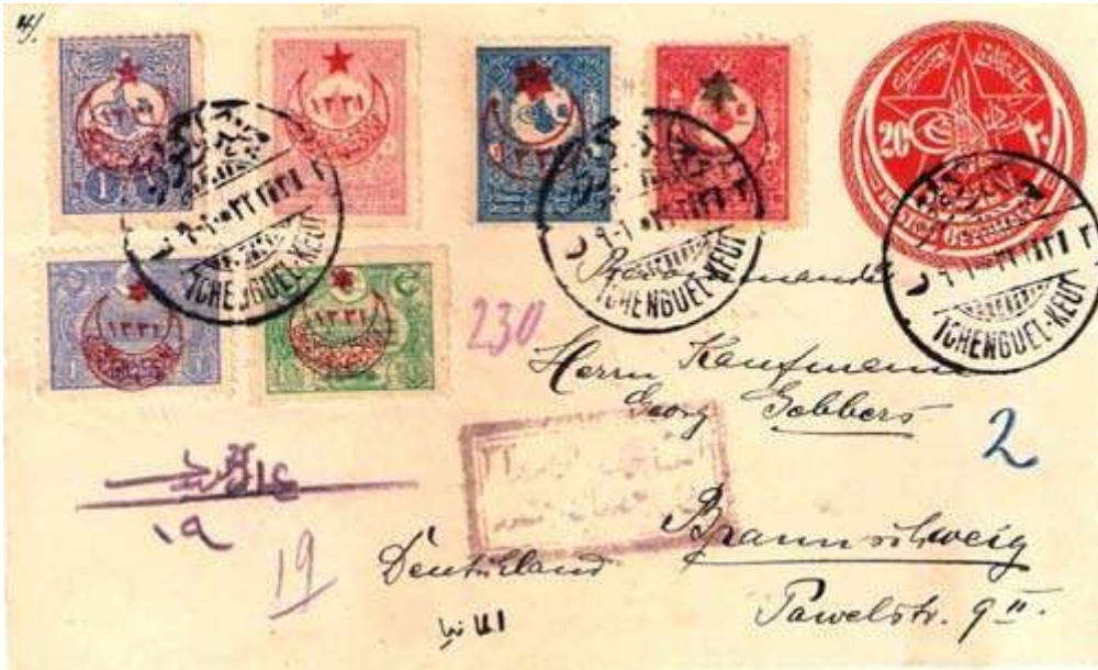
Çengelköy'den Almanya'ya gönderilmiş Evlad-ı Şüheda pullu bir zarf. Sol alttaki iki pul 1915, onların üzerindeki ikisi ise 1916 serilerindedir.

Kurtuluş Savaşı yıllarında posta ve telgraf hizmeti inanılmaz güçlüklerle rağmen sürdürüldü. Yokluk yıllarında Ankara Hükümeti, depolarda bulunan her çeşit pula sürşarj uygulayarak halkın postayı kullanmayı sürdürmesine olanak sağladı.