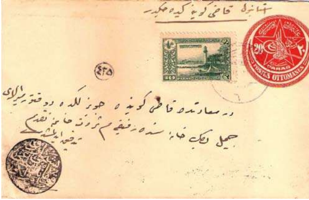
Resim 10. Kudüs askeri sansüründen geçmiş bir zarf. Mektup okunduktan sonra sol alt köşede görülen mühür uygulanmıştır.