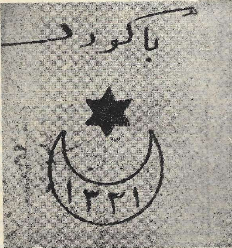
Salih Kuyaş Koleksiyonu (Resim : 3 Collection Salih Kuyaş

damganın pek önemsiz bir kısmı görülebilmektedir. Eğer (Resim 1) deki damgayı tam olarak ele geçirmemiş olsa idik damganın bu kadarlık kısmı hiçbir anlam taşımayacaktı.