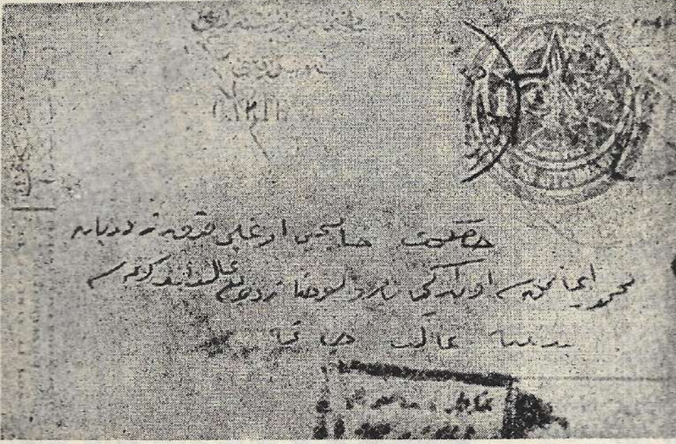
(Resim : 2)

rihli ve yalnız Arap harufatlı «Kafkas Ordusu Postası» ibareli damga bugüne kadar tam olarak elde edilmiş tek damgadır.